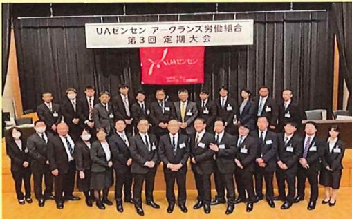
組合員とのコミュニケーションを大切にします。第3号議案で承認され新体制でスタートした執行部一同