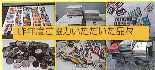
昨年度ご協力いただいた品々